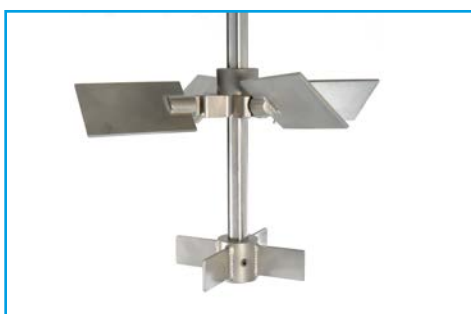
Extra impeller för omrörning vid låg vätskenivå