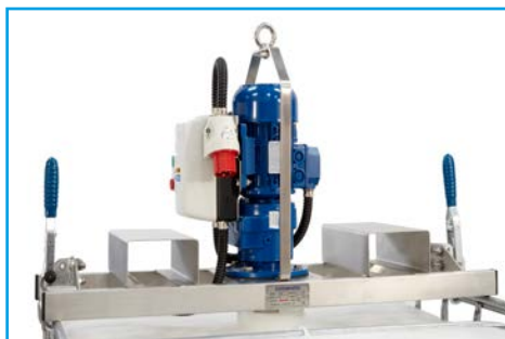
Anpassning för lyft med gaffeltruck

Omröraren kan försees med en rad smarta tillbehör.