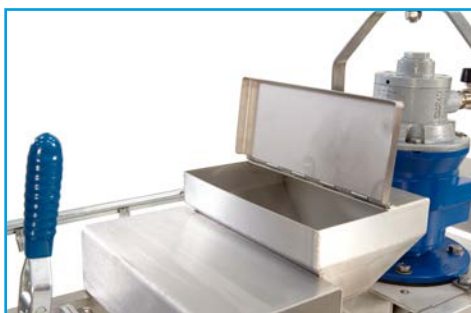
Anpassning för inblandning av pulver, polymer eller vätska