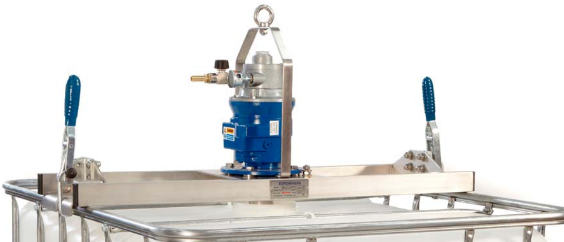
Omrörare med luftmotor

Omröraren drivs med en elektrisk eller pneumatisk motor monterad på en lättviktsbalk i stål. Med hjälp av en hopfällbar impeller monteras enheten enkelt över IBC tankens öppning och låses fast med snabbblåsande klämmor. En integrerad säkerhetsbrytare förhindrar att omröraren startas innan den är säkert monterad på en IBC tank.